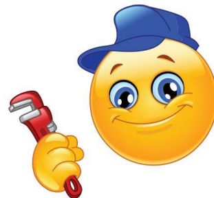
Izpildītājs (pakalpojumu sniedzējs)